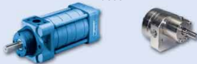
Высокоточные шестеренчатые насосы

Макс. расход: 900 л/мин Макс. давление: 350 бар